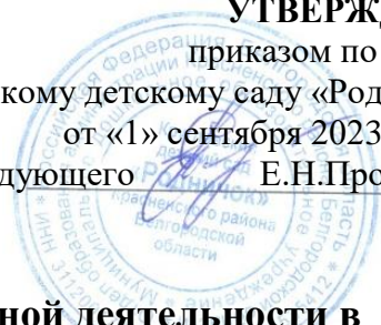
Схема распределения образовательной деятельности в разновозрастной группе «Дюймовочка» МДОУ Кругловского детского сада «Родничок» на 2023 -2024 учебный год